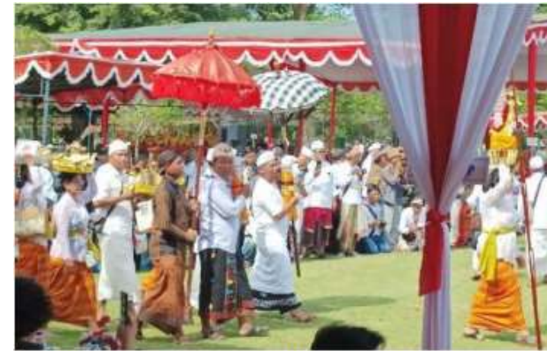
Gambar 1: Perayaan Nyepi