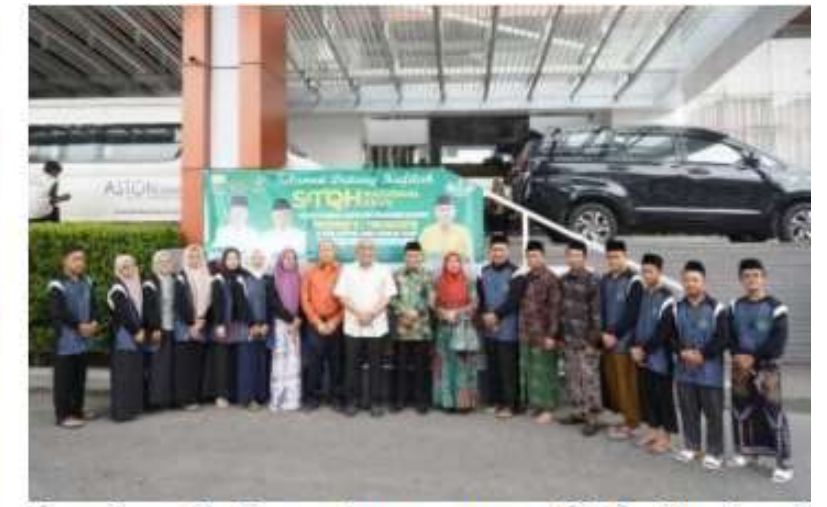
Gambar 2: Penyelenggaraan STQ Nasional di Jambi