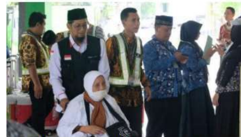
Gambar 3: Pengiriman Petugas Haji