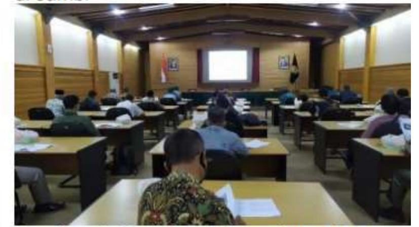
Gambar 4: Sosialisasi Penyaluran Bantuan Hibah