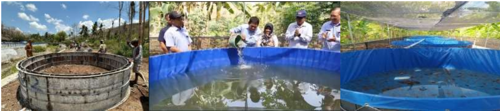
3.1 Kolam untuk Budidaya Perikanan