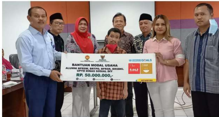
1.2 Penyerahan Bantuan Modal Usaha