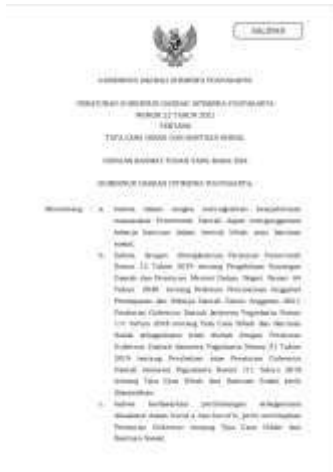
1.1 Pergub DIY No 22/2021