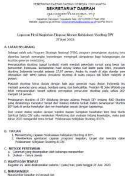
2.1 Laporan Ekspose Monev Keb Stunting DIY