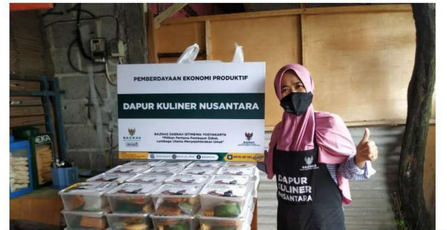
1.3 Pemberdayaan Ekonomi Produktif