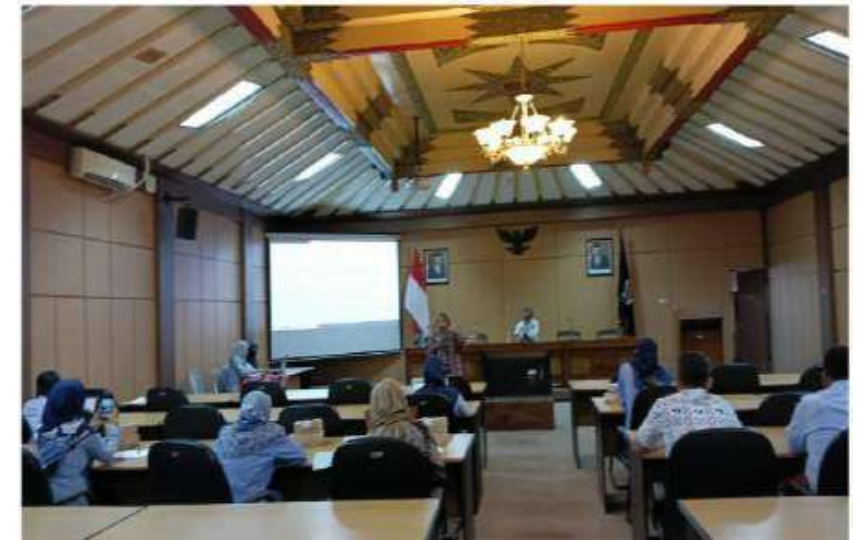
2.2 Kegiatan Ekspose Monev Keb Stunting DIY